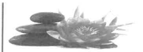
Institut de Beauté - Onglerie