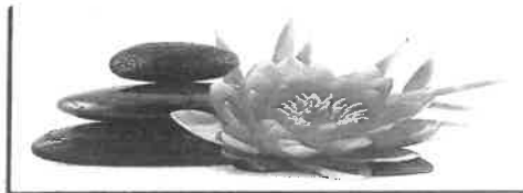
Institut de Beauté - Onglerie