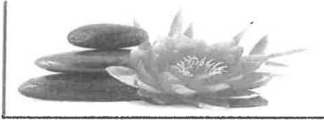
Institut de Beauté - Onglerie