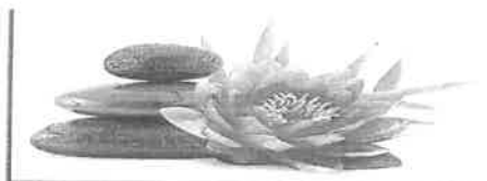
Institut de Beauté - Onglerie