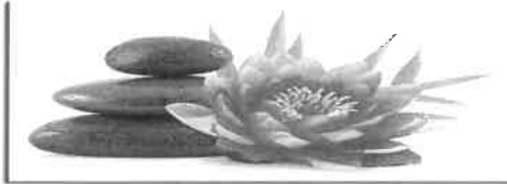
Institut de Beauté - Onglerie