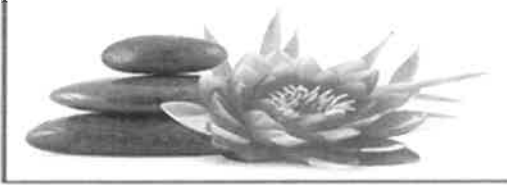
Institut de Beauté - Onglerie