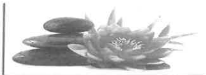
Institut de Beauté - Onglerie