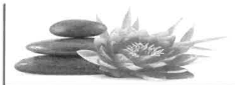
Institut de Beauté - Onglerie