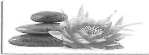
Institut de Beauté - Onglerie