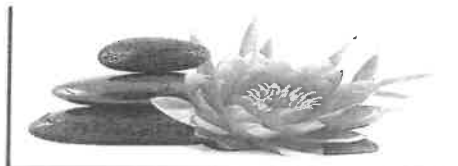
Institut de Beauté - Onglerie