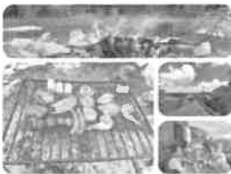
Pique-nique au chalet (en septembre)

Inscrivez-vous à nos différentes listes de diffusion pour recevoir chaque année une invitation pour participer à nos manifestations :