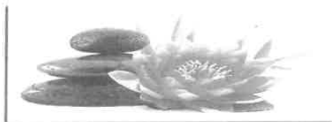
Institut de Beauté - Onglerie