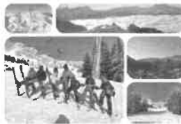
Week-end à ski (en janvier)