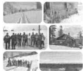
Sortie à raquettes (en février)