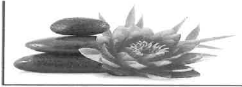
Institut de Beauté - Onglerie