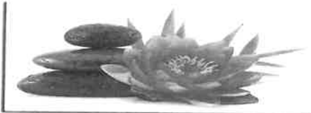
Institut de Beauté - Onglerie