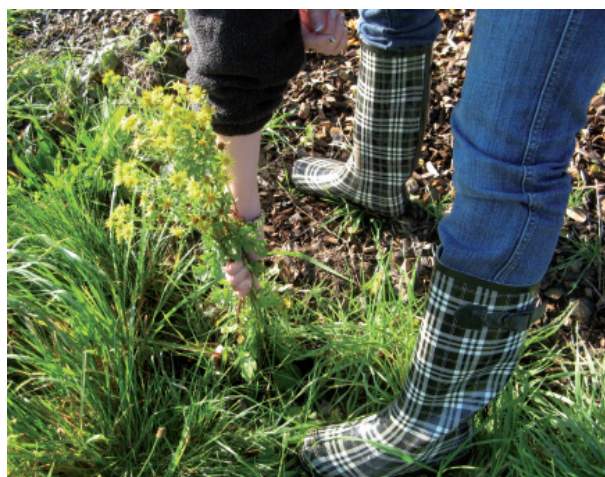
Des plantes faciles à arracher.