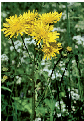
W. Dietl, ART

Sans fleurs tubulaires. Feuilles semblables aux dents-de-lion (Composées).