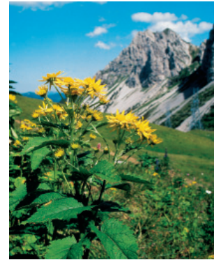
W. Dietl, ART