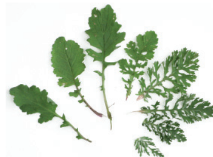
F. de rosette - F. supérieure - F. terminale avec oreillettes