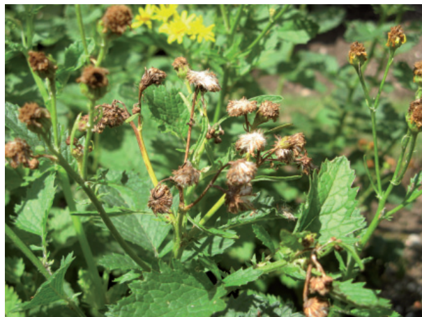
Grosse production de graines, mais tardive dans la saison.