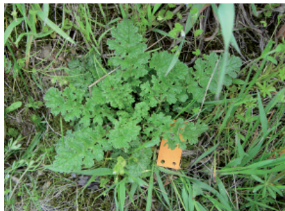
R. Gago, ART