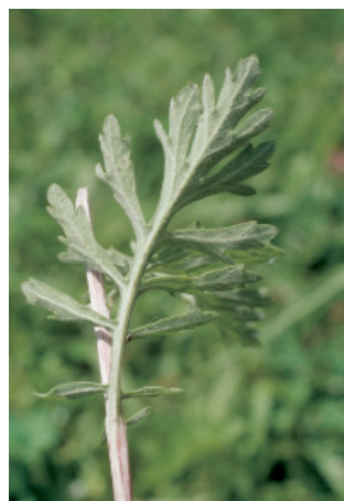
W. Dietl, ART