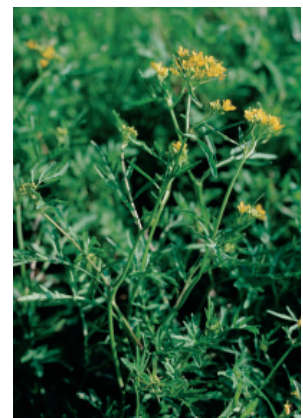
W. Dietl, ART

4 pétales environ deux fois plus longs que les sépales. Feuilles découpées jusqu'à la nervure centrale (Crucifères).