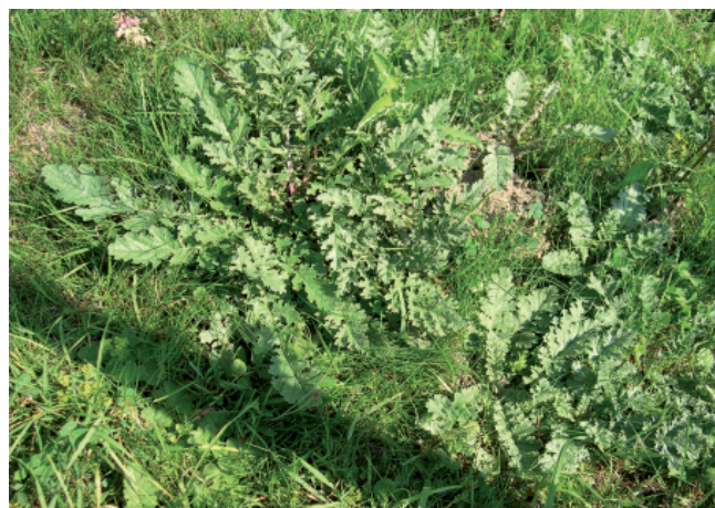
Risques d'intoxication très élevés au stade rosette, c'est-à-dire au printemps et en automne...