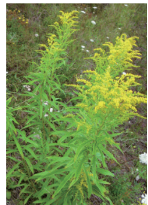
P. Aeby, IAG

Feuilles lancéolées. Grandes inflorescences pyramidales, à petites fleurs. Néophyte, à combattre (Composées).