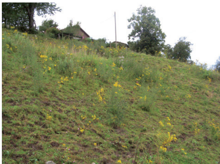
Pâturage extensif abîmé = séneçons.