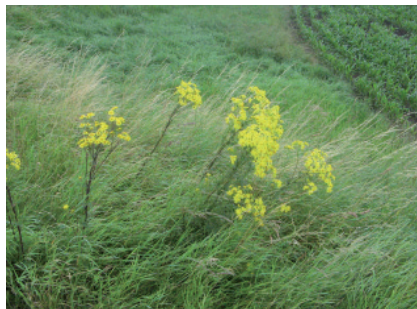
P. Aeby, IAG

Parfois aussi sur prairies ou pâturages plus intensifs, lorsque les alentours sont fortement envahis.