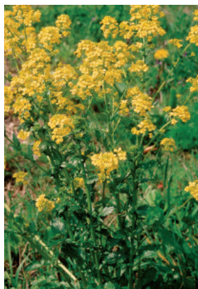
W. Dietl, ART

4 pétales de 4 - 5 mm de longueur. Feuilles inférieures découpées jusqu'à la nervure centrale, les supérieures avec un lobe ovale (Crucifères).