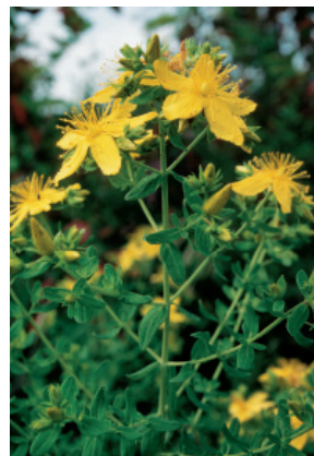
W. Dietl, ART

5 pétales et 5 sépales. Feuilles ovales et entières (Hypericacées).