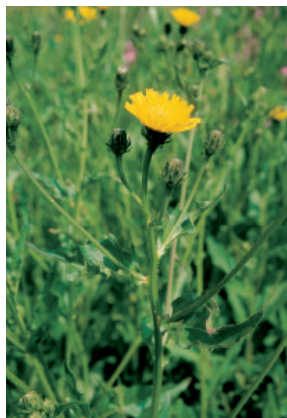
W. Dietl, ART

Sans fleurs tubulaires. Feuilles semblables aux dents-de-lion (Composées).