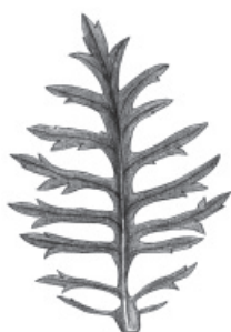
F. supérieure avec foliole allongée