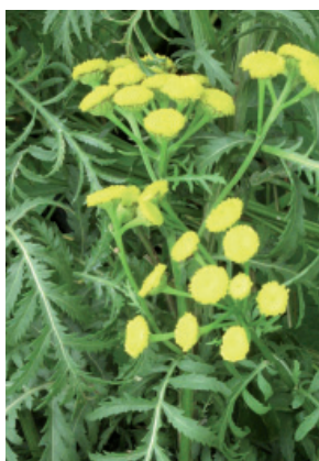
P. Aeby, IAG

Sans fleurs ligulées. Feuilles découpées jusqu'à la nervure, avec 7 - 15 divisions par côté. Aromatique (Composées).