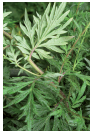
P. Aeby, IAG

Feuilles semblables à celles du séneçon jacobée, mais face supérieure quasiment sans poils et face inférieure couverte d'un feutre blanc dense. Aromatique (Composées).