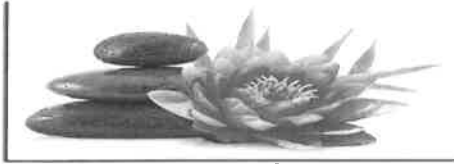
Institut de Beauté - Onglerie