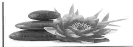
Institut de Beauté - Onglerie