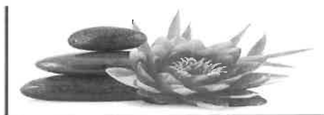
Institut de Beauté - Onglerie