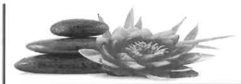
Institut de Beauté - Onglerie